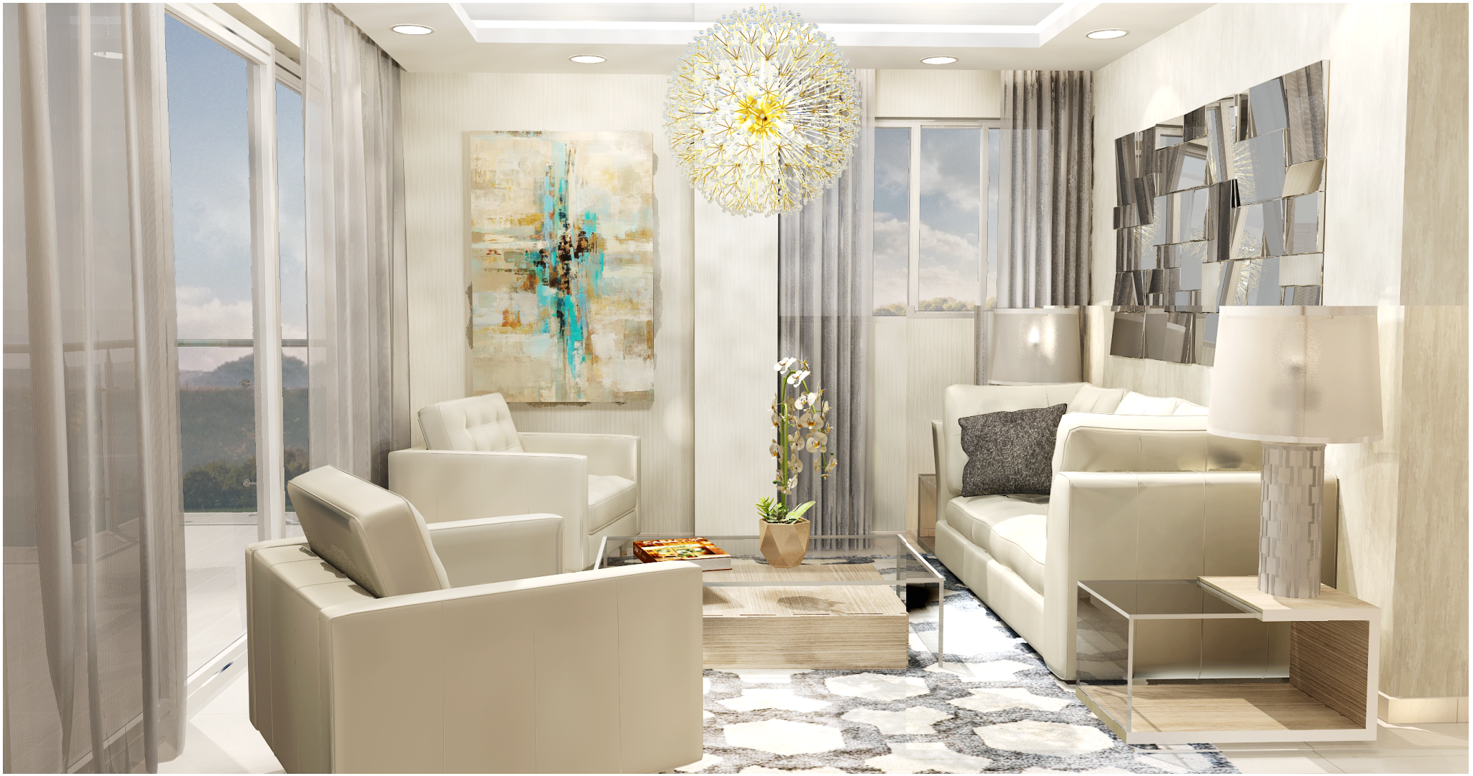
IMAGEN SUSCEPTIBLE A CAMBIOS*