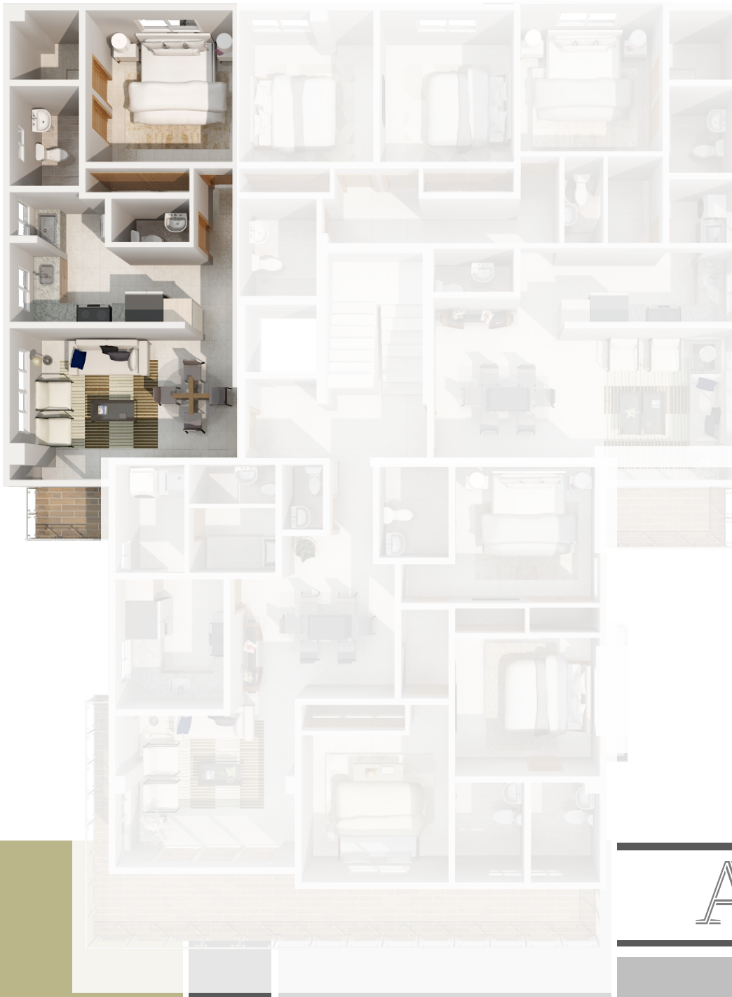
IMAGEN SUSCEPTIBLE A CAMBIOS*