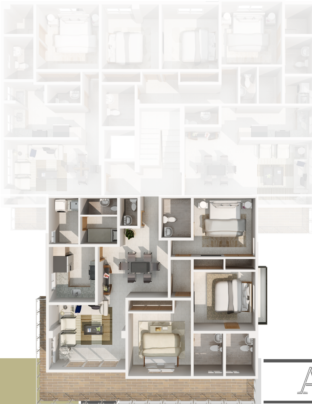
IMAGEN SUSCEPTIBLE A CAMBIOS*