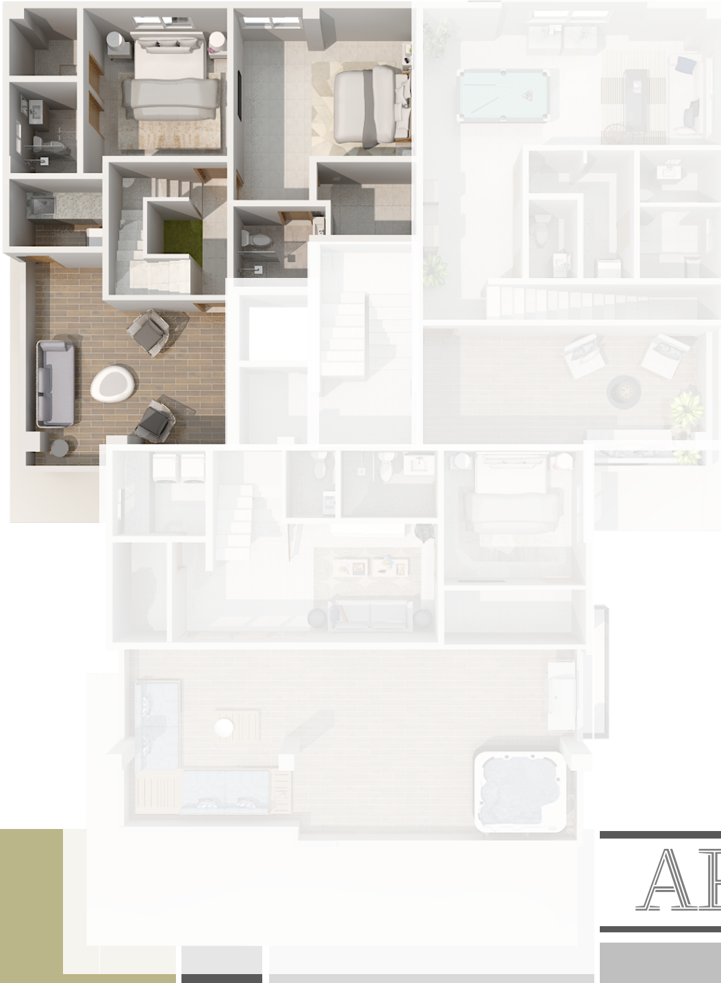
IMAGEN SUSCEPTIBLE A CAMBIOS*