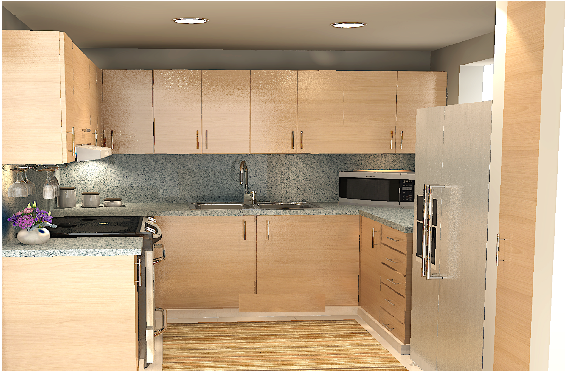
IMAGEN SUSCEPTIBLE A CAMBIOS*