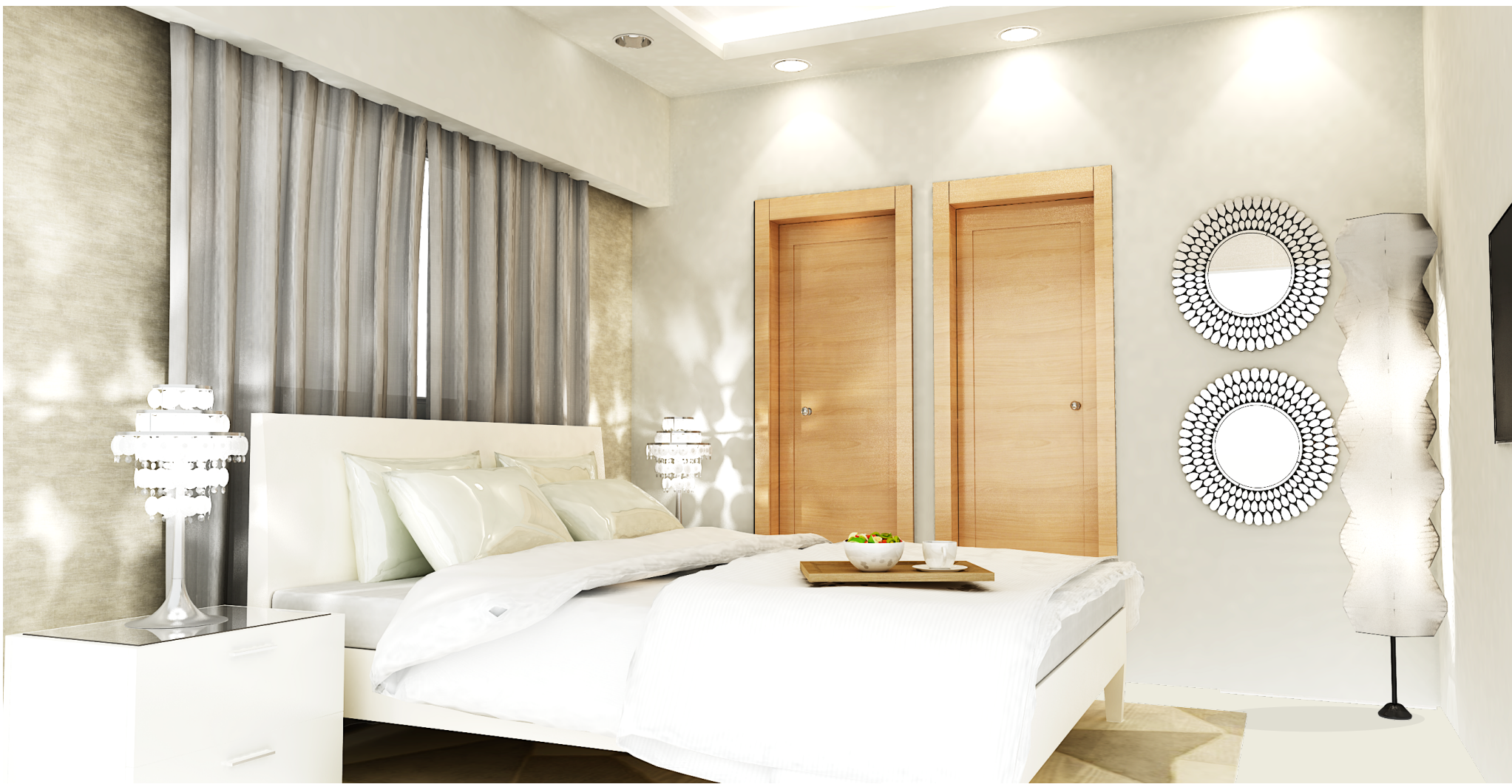
IMAGEN SUSCEPTIBLE A CAMBIOS*