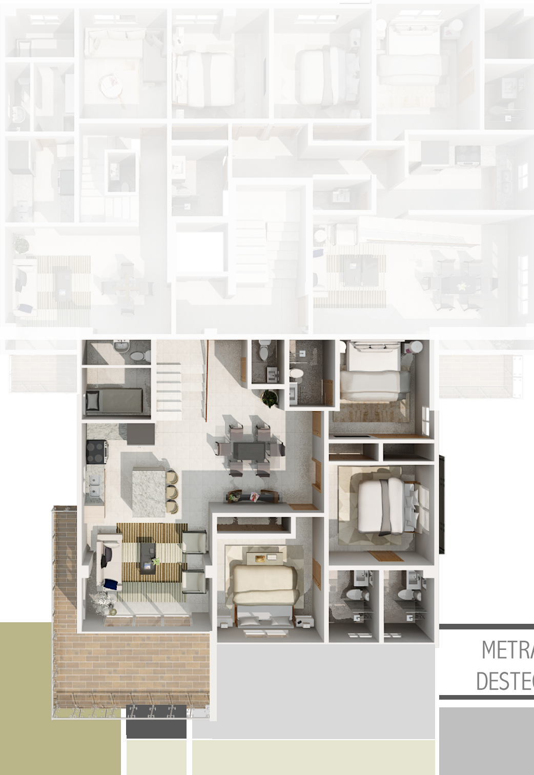
IMAGEN SUSCEPTIBLE A CAMBIOS*