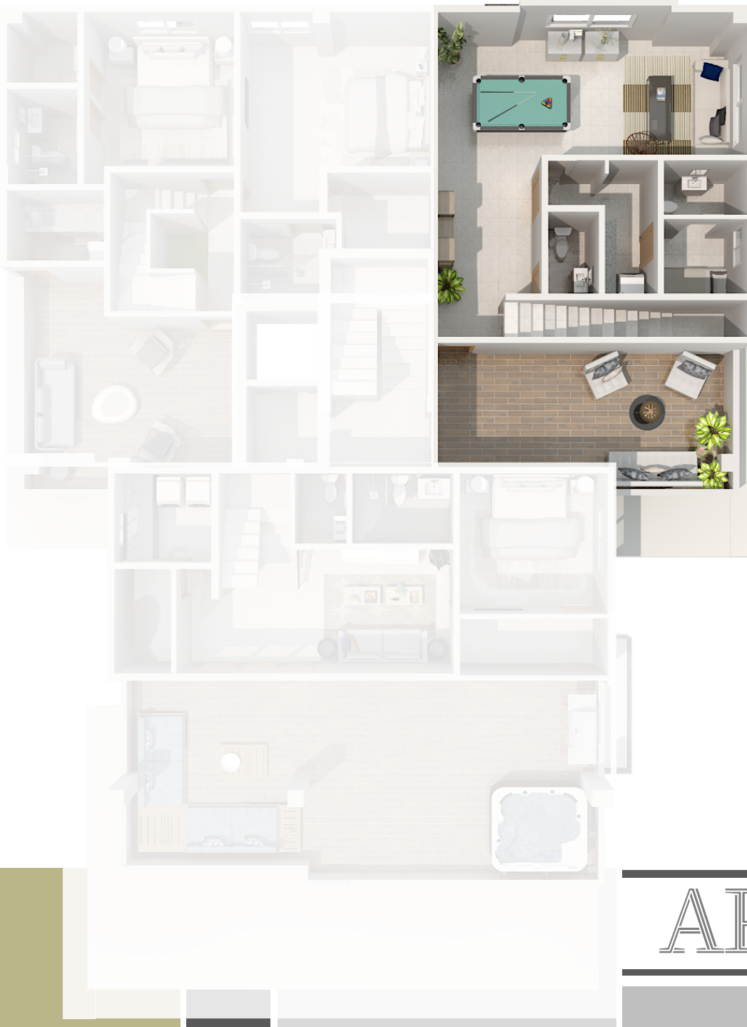
IMAGEN SUSCEPTIBLE A CAMBIOS*