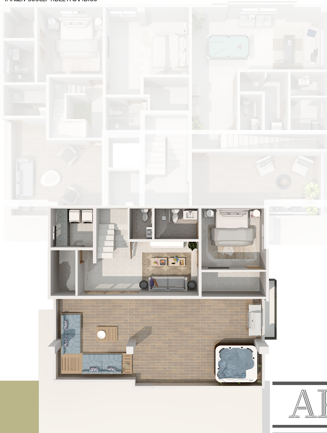
IMAGEN SUSCEPTIBLE A CAMBIOS*