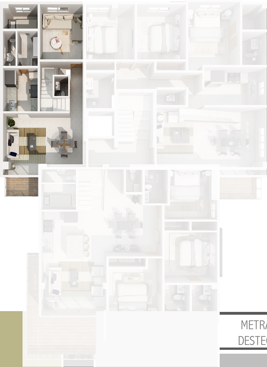
IMAGEN SUSCEPTIBLE A CAMBIOS*