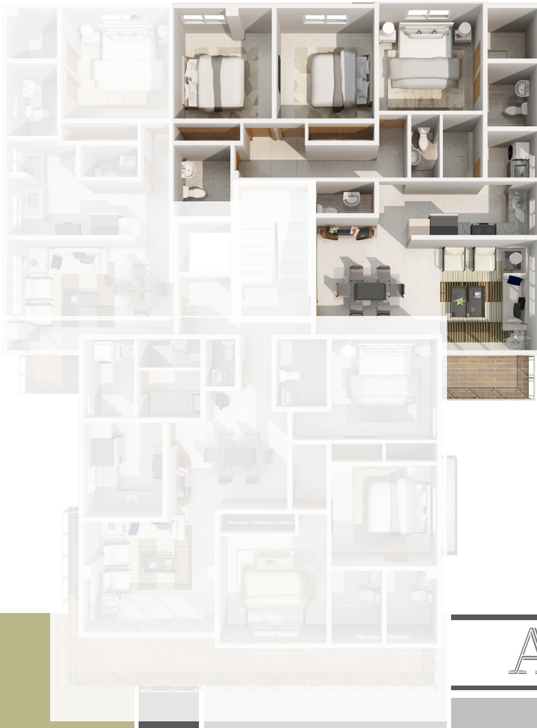
IMAGEN SUSCEPTIBLE A CAMBIOS*