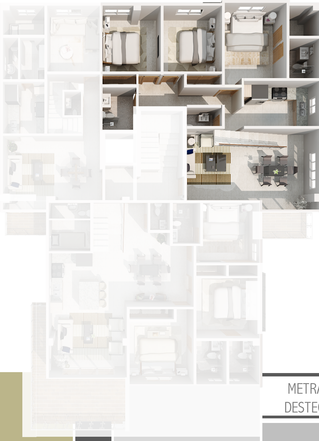
IMAGEN SUSCEPTIBLE A CAMBIOS*