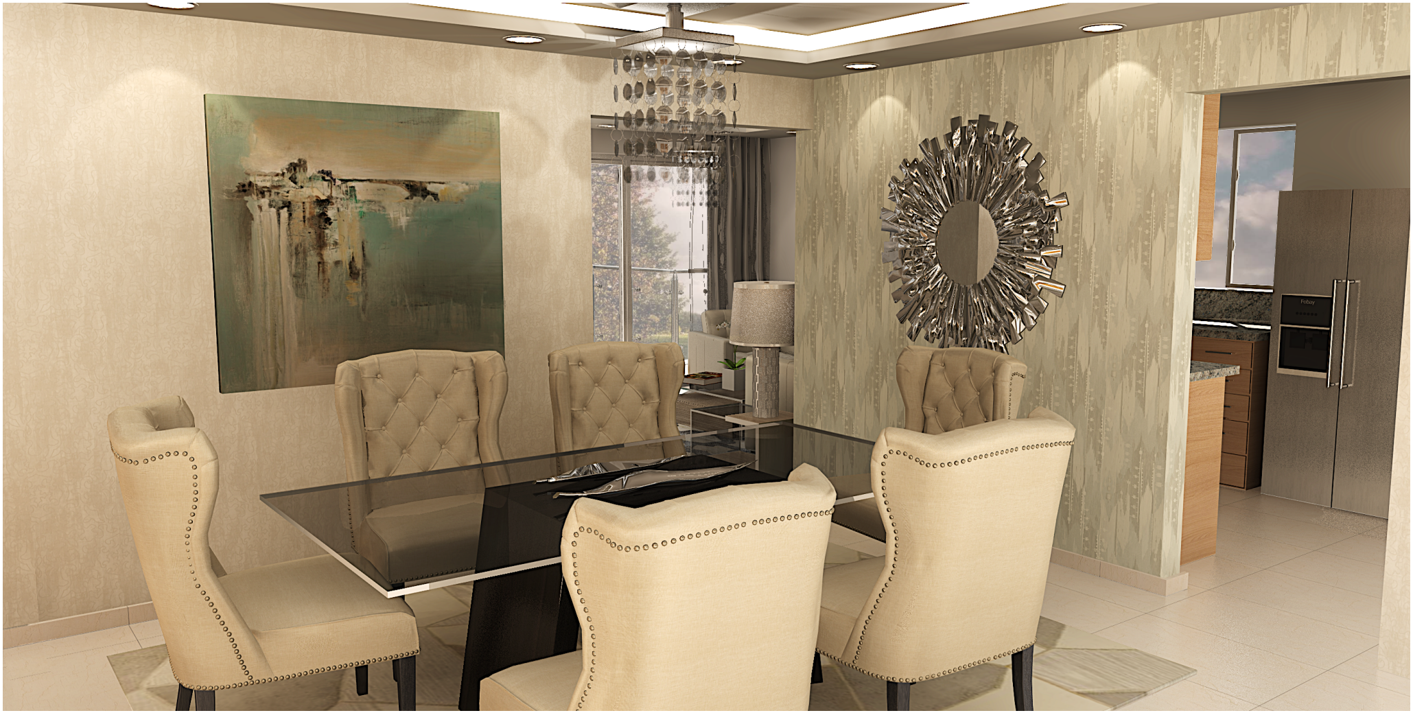
IMAGEN SUSCEPTIBLE A CAMBIOS*